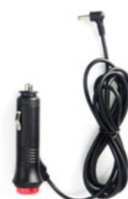
Napájecí kabel s CL