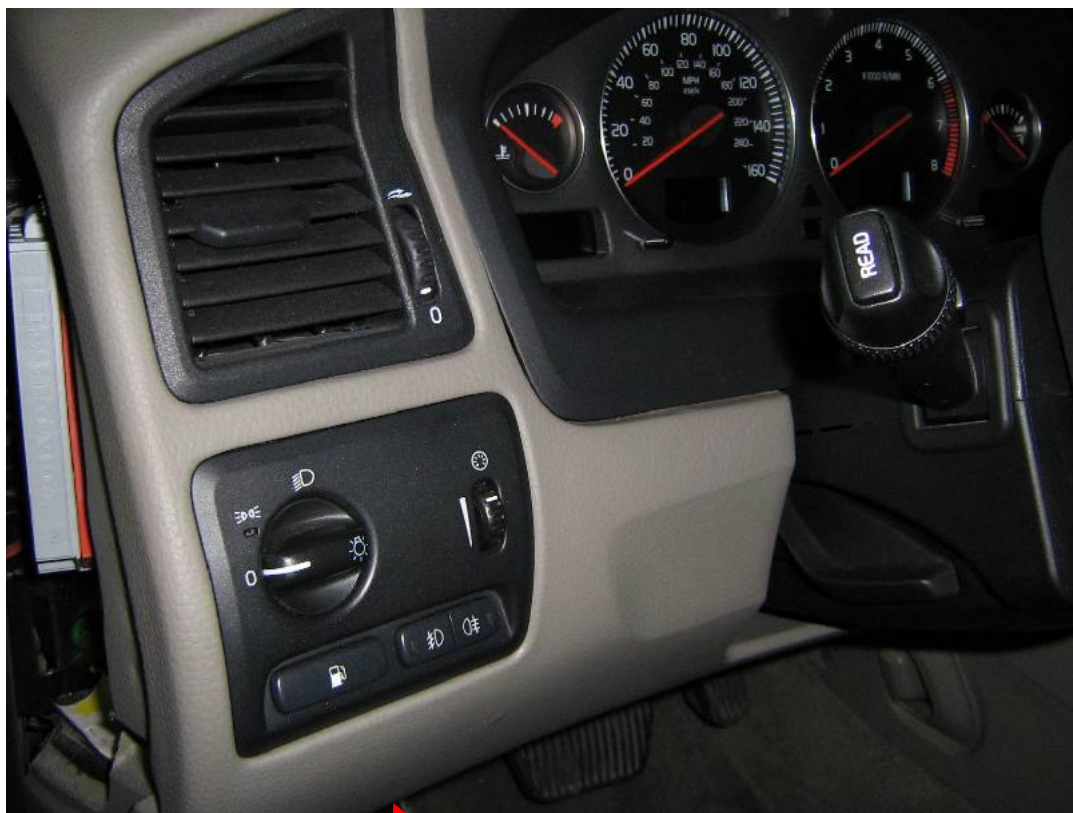
Modul CEM vlevo pod řízením