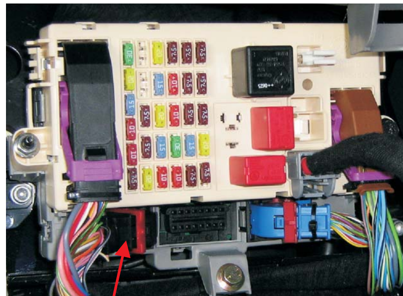
Přední strana pojistkové skříňky

Ovládání centrálního zamykání - černý konektor modrožlutý (pin 28)