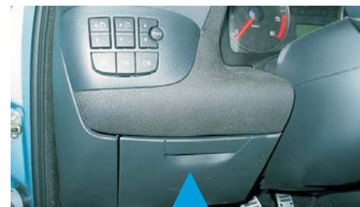
Umístění spínací skříňky