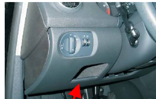
Umístění spínací skříňky

Černý konektor "F" 8 pinů Spínač u kapoty - hnědočervený (pin 5)